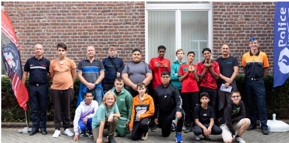
Photo souvenir d'une belle journée vécue par nos 1D et 2D chez les policiers et pompiers de la zone Vesdre.